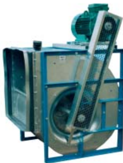
Construction RT M