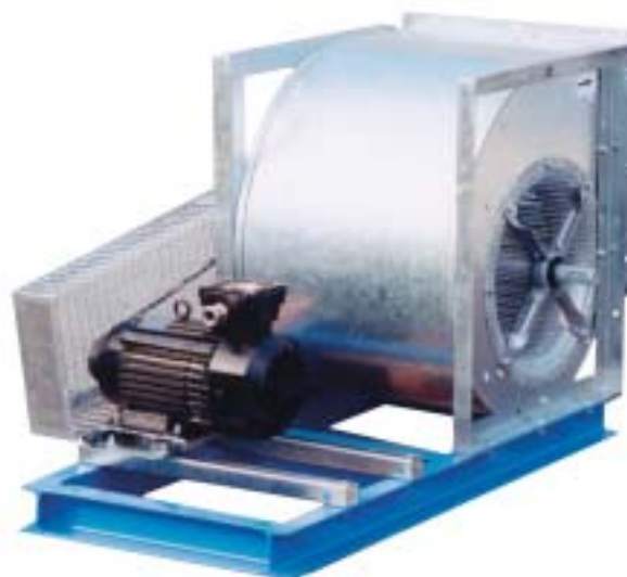
Construction RT CA

Pour obtenir des plans plus détaillés, CONSULTEZ NOS SERVICES !